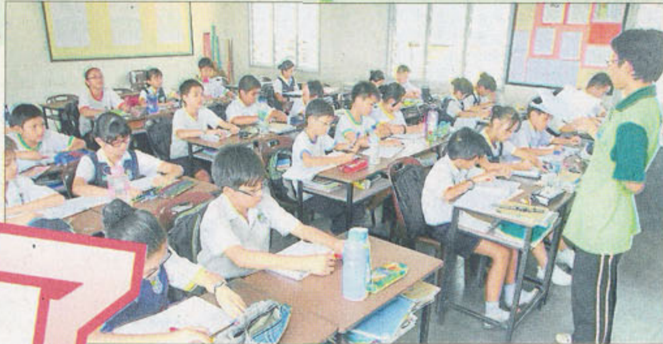
霹靂多間小學將在明年新學期增加教師，師資短缺情況不嚴重。

文告指出，假期師訓班是解決華小師資不足問題其中一項有效方案，受訓臨教不會因為受訓而造成學校出現空缺。因此，隨著這次假期師訓班的落實，也意味著華小將增加728位大學資格合格教師，這將進一步解決華小師資不足的問題。