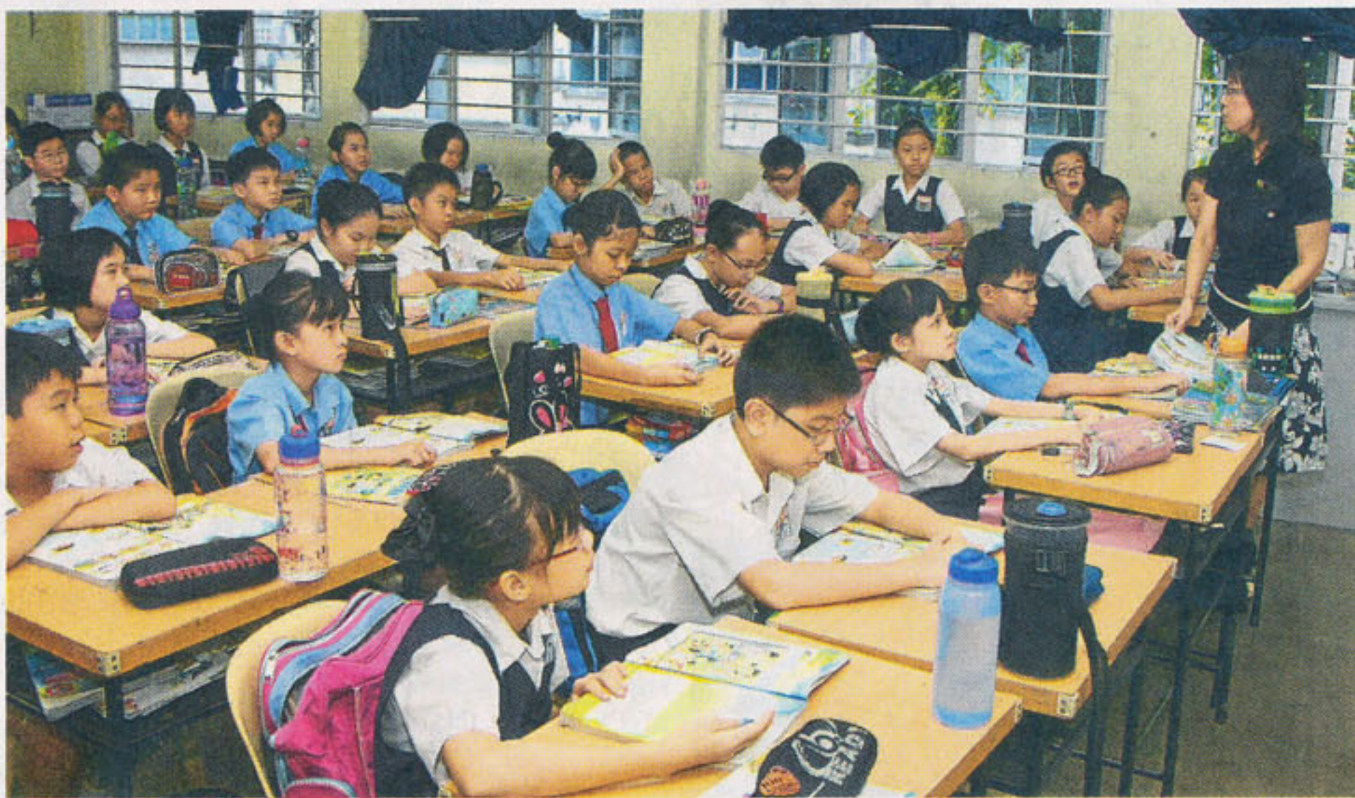
教总吁请教育部针对增加华小国文教学课题召开圆桌会议。(档案照)

任是引领学生成人成才，为国家培养人力资本，政府把国民团结的责任加诸于学校，并指多源流学校制度影响国民团结，是非常不负责任的做法。