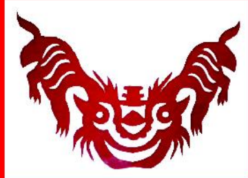
老师作品：双虎争亡