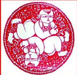
老师作品：四喜娃娃